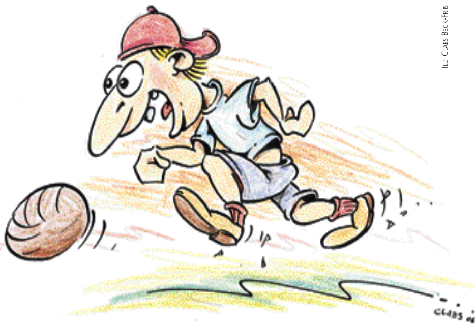
ILL. CLAES BECK-FRIS

Invaliditetstillägget gäller dygnet runt. Olycksfallsskyddet är värdesäkrat och